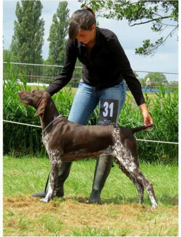
Position « statique »