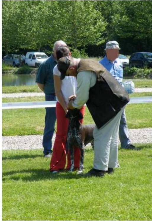
Vérification de la dentition

Pour présenter son chien à la confirmation ou en exposition canine, il faut l'entraîner un peu pour la présentation avant l'exposition.