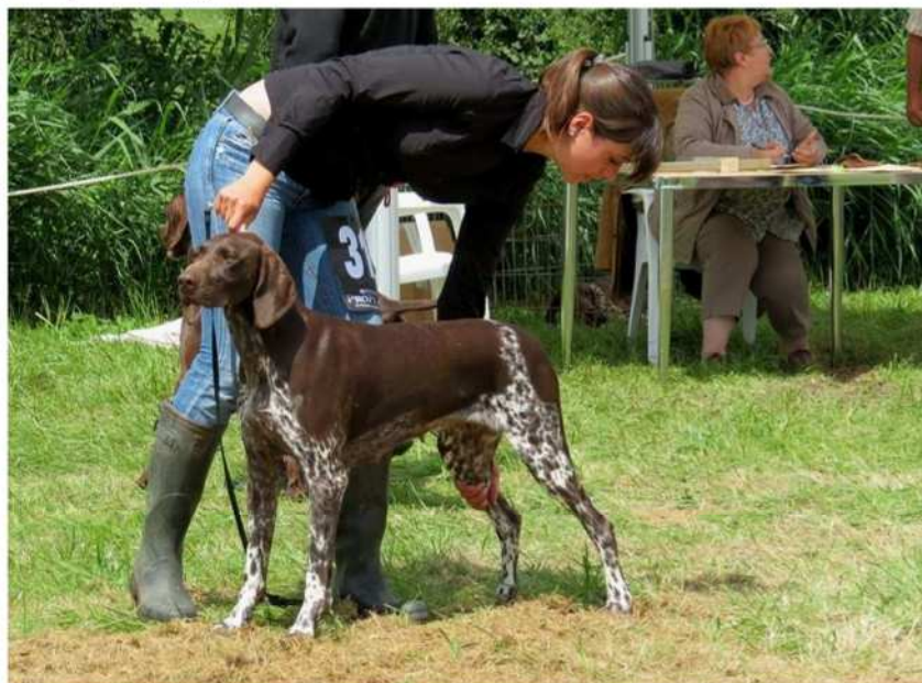
Mise en position « statique »

Les membres du chien doivent être parallèles, les pattes arrières légèrement reculées de façon à faire ressortir les angulations, la tête doit être droite (ne pas tenir tout le museau juste le soutenir pour ne pas cacher les babines et le chanfrein ou ne pas tenir du tout et juste maintenir la tête fière avec la laisse), la queue légèrement levée.